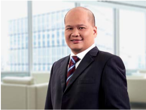
DATUK SHAHRIL RIDZA BIN RIDZUAN (DSIS),(PJN)