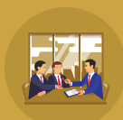
i-Akaun (Rakan Niaga)