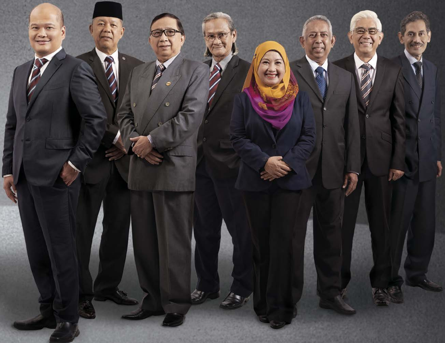
DATUK SHAHRIL RIDZA RIDZUAN Ketua Pegawai Eksekutif - KWSP