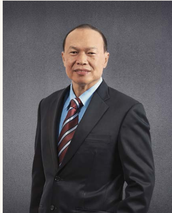
TAN SRI DR. LIM WEE CHAI

Selain itu, beliau juga merupakan Pengerusi Confederation of Asia Pacific Employers (CAPE) , Pengerusi Asean Confederation of Employers (ACE) , Ahli Substantif National Labour Advisory Council (NLAC) , Ahli Majlis Perundingan Gaji Negara (MPGN), Kementerian Sumber Manusia, Ahli Suruhanjaya Perkhidmatan Awam (SPA).