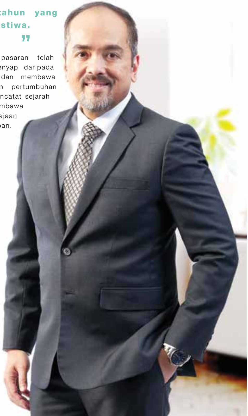
↑ TUNKU ALIZAKRI RAJA MUHAMMAD ALIAS Ketua Pegawai Eksekutif

Dari sudut peribadi, tahun 2018 juga menandakan titik penting dalam kerjaya saya - mengambil alih mandat Ketua Pegawai Eksekutif pada bulan September, satu peranan yang sebelum ini dipikul dengan penuh wibawa oleh Datuk Shahril Ridza Ridzuan. Dengan sokongan yang diberikan oleh pasukan dalam organisasi, serta menyedari akan keyakinan dan kepercayaan yang diberikan kepada saya, sukacita saya maklumkan bahawa KWSP telah melalui proses peralihan kepimpinannya dengan lancar. Lebih penting lagi, komitmen saya dan warga KWSP untuk mencapai visi KWSP, menegaskan semula peranan kami di Malaysia dan memacu misi KWSP untuk melaksanakan tanggungjawab kami tetap jelas serta tidak berbelah bahagi.