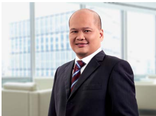
DATUK SHAHRIL RIDZA BIN RIDZUAN (DSIS),(PJN)