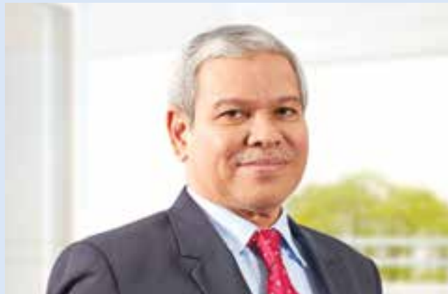
Ketua Setiausaha Perbendaharaan, Kementerian Kewangan