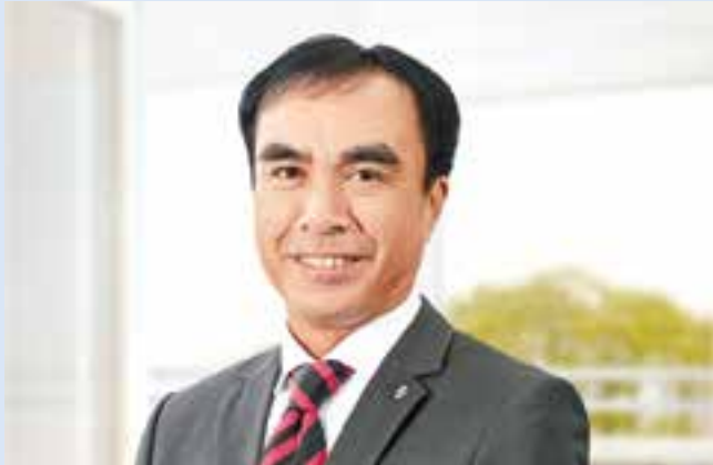
Penolong Gabenor, Bank Negara Malaysia