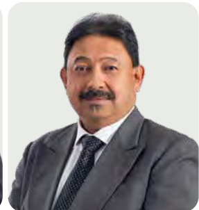
Dato' Mohammed Azlan Hashim 1.9.2020

Timbalan Pengerusi Panel Pelaburan, Kerajaan